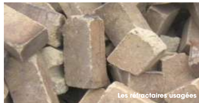
Les réfractaires usagées