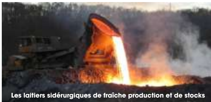
Les laitiers sidérurgiques de fraîche production et de stocks