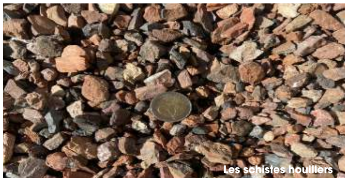
Les schistes houillers