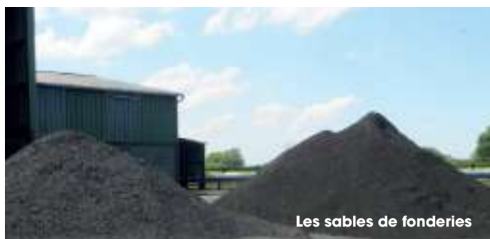
Les sables de fonderies