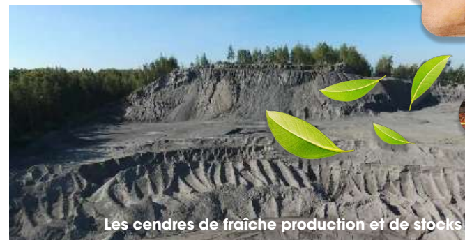
Les cendres de fraîche production et de stocks