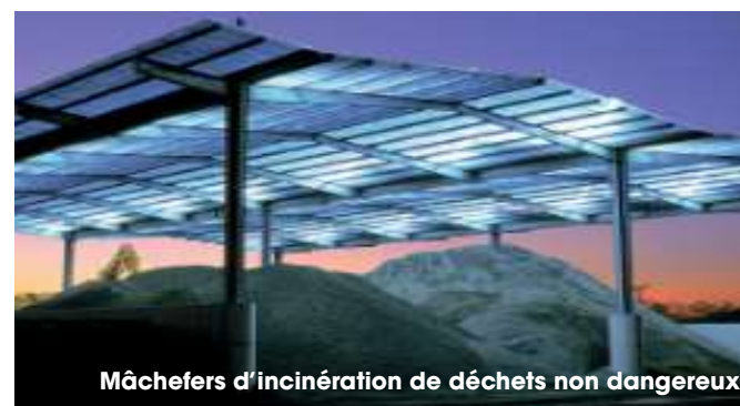
Mâchefers d'incinération de déchets non dangereux